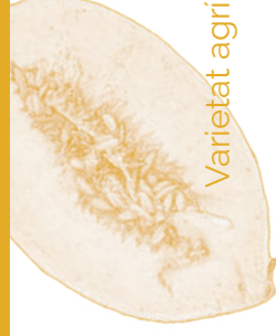
Varietat agrícola tradicional

Llavor de Meló tendral de la Vall d'Albaida 20 U. ————— Cucumis melo