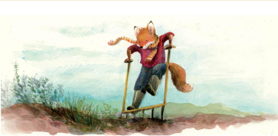
El naixement d'un hort

Va assegurar el costat del pi de gran alçada que hi havia davant de l'hort i va començar a gradar la terra. Li agradava la sensació d'humitat i frescor que desprènien i la flocaven les diferents textures que s'hi podien trobar.