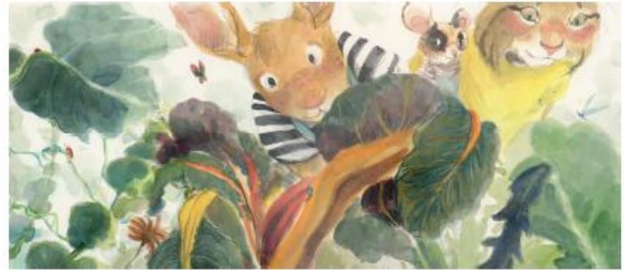
Un hort ple de vida

Preveu ser aquell element visualment atractiu que, present a les parets de totes les llars, botigues i empreses, pugui acompanyar-nos al llarg de l'any i ajudar-nos a construir una societat més sostenible i justa.